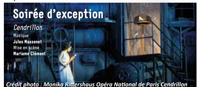
Crédit photo : Monika Rittershaus Opéra National de Paris Cendrillon

L'année s'est achevée par la retransmission de l'OPÉRA – CENDRILLON, grâce à une nouvelle soirée prestige de l'Opéra National de Paris.