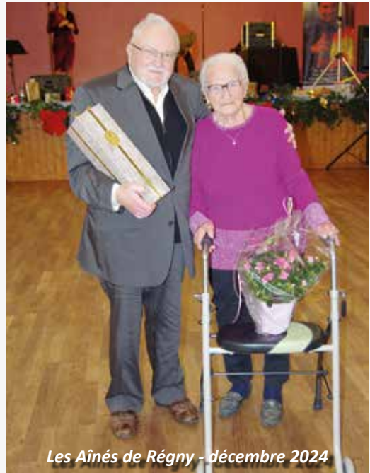
Les Aînés de Régny - décembre 2024

Cette journée de fin d'année est donc l'occasion pour la commune de témoigner son soutien et son affection envers nos aînés. La municipalité, à travers son CCAS, souhaite continuer à perpétuer cette tradition dans les années à venir pour rendre hommage à nos résidents âgés qui contribuent grandement à la richesse et à la mémoire de notre commune.