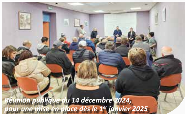
Réunion publique du 14 décembre 2024, pour une mise en place dès le 1 er janvier 2025